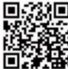
景德镇考区会计资格证书邮寄信息采集表

受理地址及电话：景德镇市昌江区瓷都大道686号市财政局会计科（322室），电话0798—8298638。