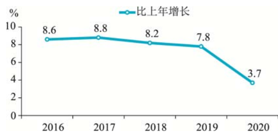
图 1 2016-2020 年地区生产总值增长速度

经省统计局统一核算，全年地区生产总值 957.14 亿元，比上年增长 3.7%。其中，第一产业增加值 68.07 亿元，增长 1.9%；第二产业增加值 412.84 亿元，增长 3.5%；第三产业增加值 476.23 亿元，增长 4.3%。三次产业结构比为 7.1：43.1：49.8，三次产业贡献率分别为 3.1%、44.8%、52.1%。