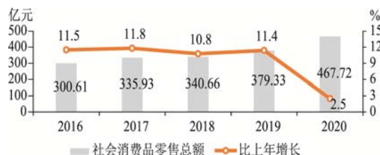
图 4 2016-2020 年社会消费品零售总额及其增长速度

品类增长 10.6%，家用电器和音像器材类下降 8.5%，中西药品类增长 21.0%，文化办公用品类增长 41.2%，家具类增长 18.8%，通讯器材类下降 37.1%，建筑及装潢材料类增长 14.9%，石油及制品类下降 0.9%，汽车类增长 4.7%。