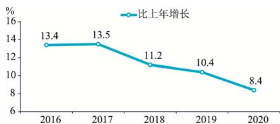
图 5 2016-2020 年固定资产投资增长速度

全年完成固定资产投资比上年增长 8.4%。其中，民间投资增长 15.1%，占固定资产投资的比重为 62.9%。