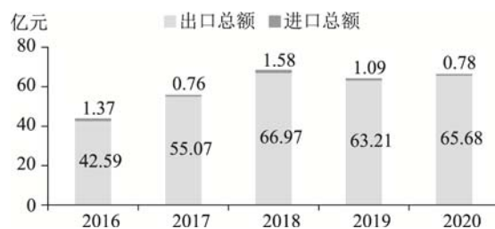
图 6 2016-2020 年进出口总额