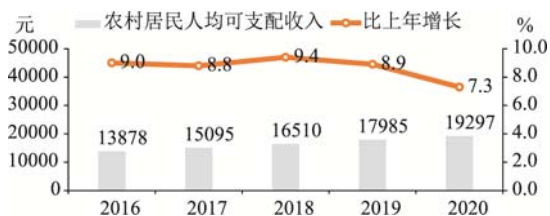
图 9 2016-2020 年农村居民人均可支配收入及其增长速度