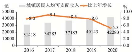
图 8 2016-2020 年城镇居民人均可支配收入及其增长速度

基本医疗保险人数 39.47 万人，增加 4.1 万人；参加城乡居民基本医疗保险人数 127.13 万人，增加 2.68 万人。全年领取失业保险金人数 1648 人。参加工伤保险人数 22.57 万人，增加 1.3 万人，其中参加工伤保险的农民工 2.9 万人，增加 0.03 万人。参加生育保险人数 200844 人，增加 1.94 万人。2020 年末共有 19406 户 32903 人享受城市居民最低生活保障，22542 户 39381 人享受农村居民最低生活保障，2853 人享受农村特困人员救助供养，全年临时救助 7369 人次。全年资助 71089 人参加基本医疗保险，医疗救助 101013 人次。国家抚恤、补助退役军人和其他优抚对象 6798 人。城市居民最低生活保障标准 720 元/人月，农村居民最低生活保障标准 480 元/人月。