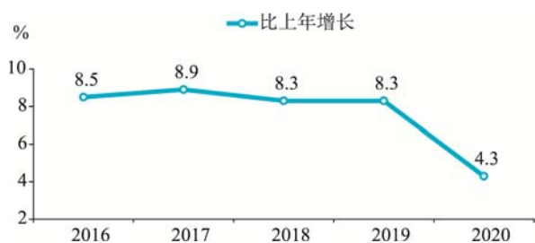
图 3 2016-2020 年规模以上工业增加值增长速度

全年全社会工业增加值 367.55 亿元，比上年增长 3.4%。规模以上工业增加值增长 4.3%。在规模以上工业中，分经济类型看，国有企业下降 49.6%，集体企业增长 2.3%，股份制企业增长 3.7%，外商及港澳台商投资企业增长 10.8%，其他经济类型企业增长 26.5%。