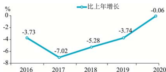
图 10 2016-2020 年万元 GDP 能耗降低率

全年能源消费总量 454.21 万吨标准煤，比上年增长 3.66%；其中，工业能源消耗总量 326.71 万吨标准煤，增长 4.31%。万元 GDP 能耗下降 0.06%，万元规模以上工业增加值能耗增长 0.42%。