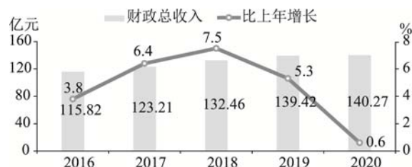
图 7 2016-2020 年财政总收入及其增长速度

全年财政总收入 140.27 亿元，比上年增长 0.6%；一般公共预算收入 100.05 亿元，增长 0.4%。在财政总收入中，税收收入 102.09 亿元，下降 0.2%，税收收入占比 72.8%。